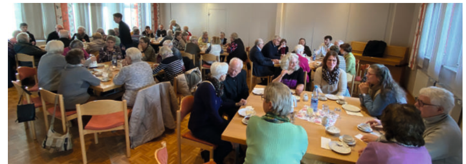
Der Gemeindesaal war voll.