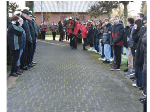
Spalier vor der Kirche