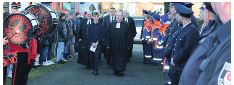
Einzug durch das Spalier vor der Kirche