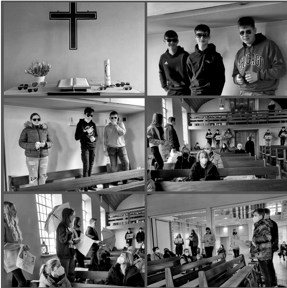
Zum letzten Konfirmandenblock wurde intensiv gearbeitet zum Thema „Meine Lebensreise“

Auch dieses Jahr wieder als Klappstuhl-Gottesdienst auf unserer Wiese