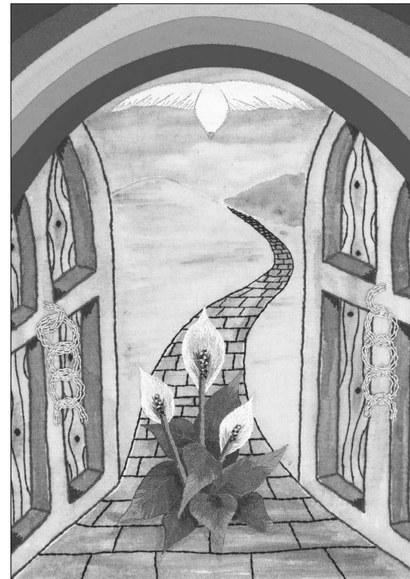
Bild zum Weltgebetstag 2022 England, Wales & Nordirland mit dem Titel „I Know the Plans I Have for You“ von der Künstlerin Angie Fox